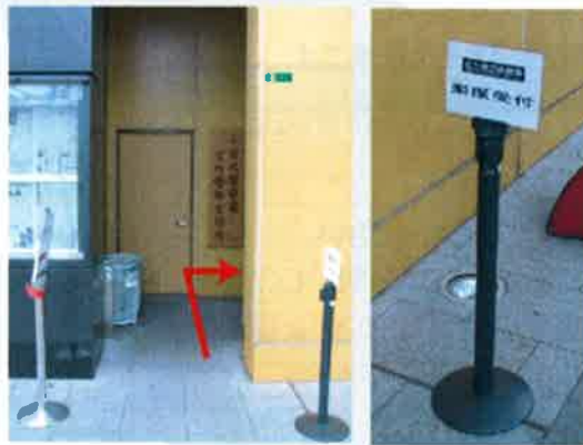
楽屋入口拡大写真