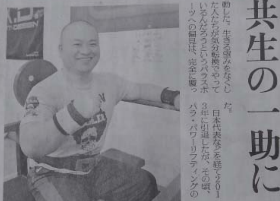
1971年、長野県生まれ。伊那市立、駒沢大卒業後、県内に就職し、アイスレスティングホッケーに出会う。日本代表選手としてトリノパラリンピックに出場し、5位。バンクーバー大会では銀メダルを獲得した。現在、日本オラクル（東京）勤務。47歳。

大会で人間の限界を突破しようとする姿を見て「美しい」と思った。松本市に所属している指導者がいるジムがあり、20年の東京パラリンピックを目指すことに。元々力には自信があった。 日本代表を経て2011年に引退したが、その頃、パラ・パワーリフティングの大会に出場できるのは各階級8人とされ、77歳で