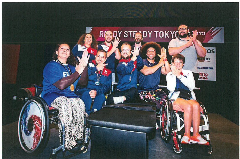
テストイベント参加のフランスチーム、満足な結果が得られたようです。

そのほか、鉄には様々な働きがありますが、鉄の不足がパフォーマンスを大きく左右することを考え、一度、健康診断書の血液検査欄をご覧ください。