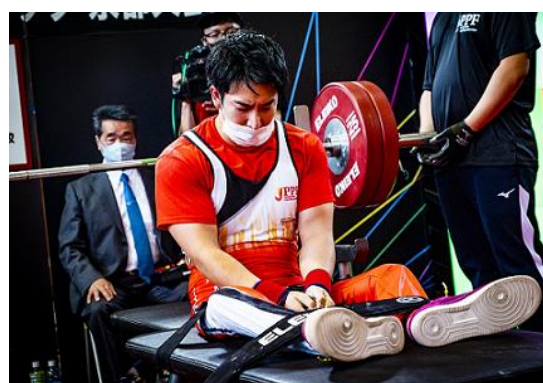
第3回チャレンジカップ京都大会 (令和2年10月3日、4日開催)