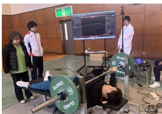
動作解析デモンストレーションの様子

合宿: 計 33 回 練習会: 計 204 日 チャレンジカップ京都大会: 計 3 回